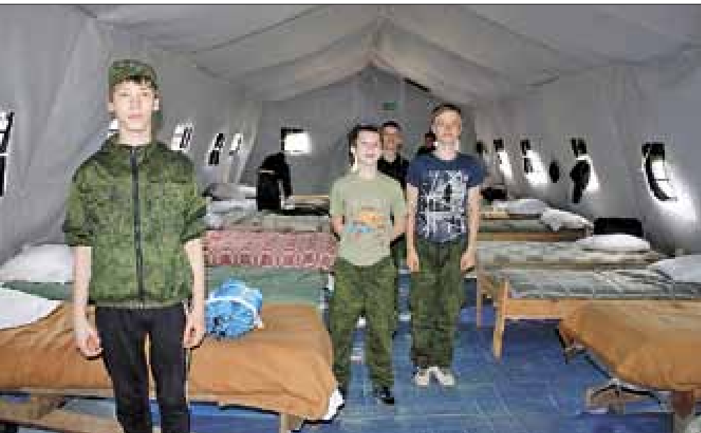
К проверке готовы!

«Архангел» дети учатся быть защитниками Родины