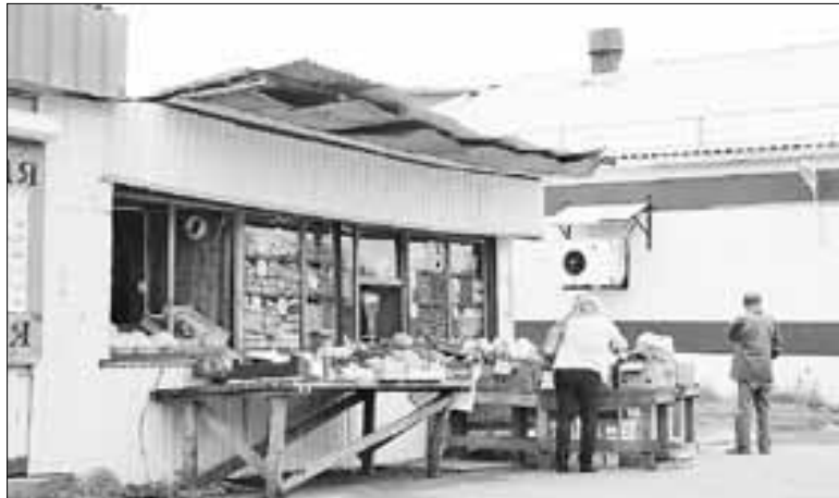
■ Импровизированный фруктовый базар возле магазина «Магнит» на перекрестке улиц Советской и Кедрова

Совсем из ряда вон – фруктовые развалы прямо на автобусной остановке на Тимме у роддома имени Самойловой. От отъезжающих пазиков смрад такой, что дышать нечем, пыль столбом. Наверняка свежие «витамины» покупают новоиспеченным мамочкам и беременным. Просто верх цинизма – новорожденный с молоком матери тут же получит дозу свинца и вредных канцерогенов.