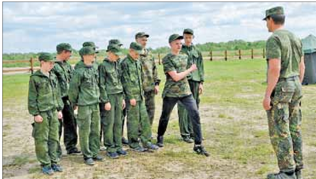
■ Первый взвод – строевым шагом... в столовую

После занятий курсанты разбредаются по палаткам и территории – готовятся ко второму завтраку. Мы с начальником лагеря, пока есть свободная минутка, отдыхаем на скамейках под тенью навесом. Здесь же, под навесом, установлено музыкальное оборудование, ноутбуки и проектор для просмотра военных фильмов и презентаций.