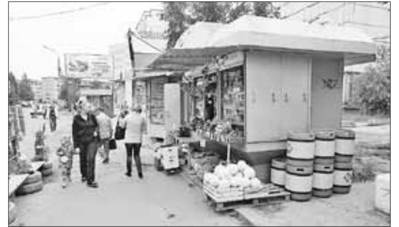
■ Ларек на автобусной остановке на Тимме у роддома имени Самойловой