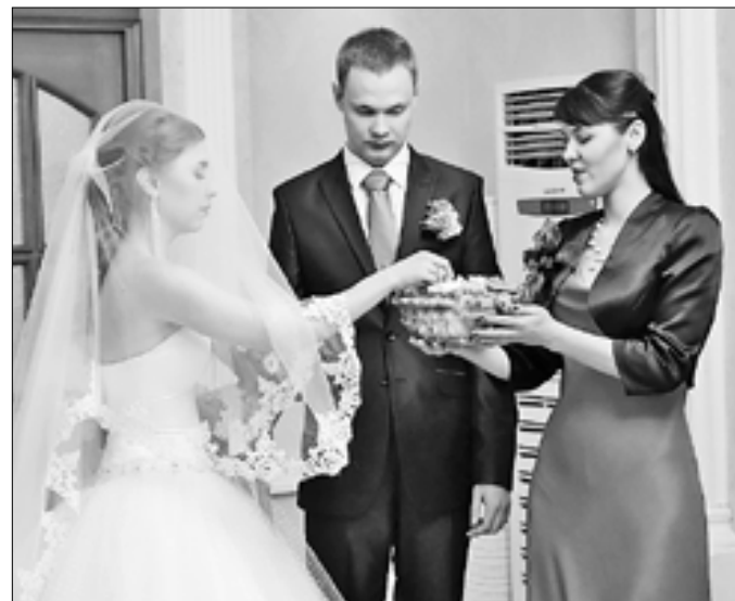
■ Торжественный момент – обмен кольцами