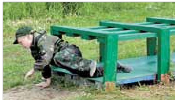
■ В оборонно-спортивном лагере «Архангел» даже полоса препятствий как в армии